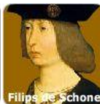
Filips de Schone