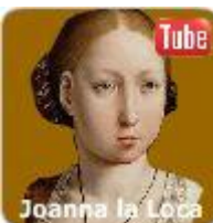
Joanna la Loca