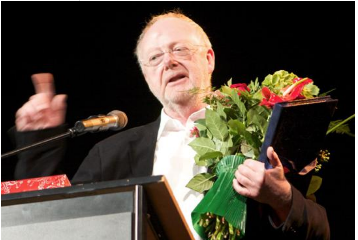
Dankwoord Louis Andriessen