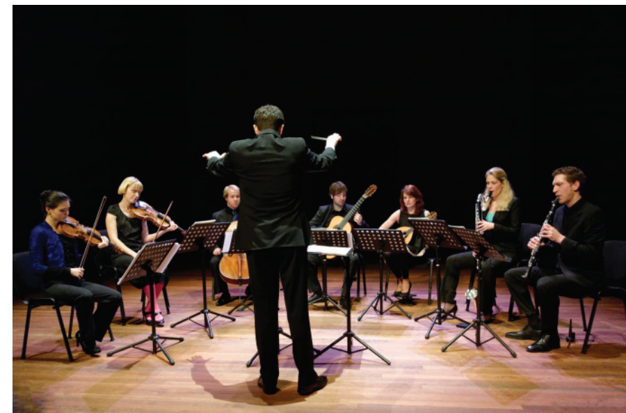
New European Ensemble