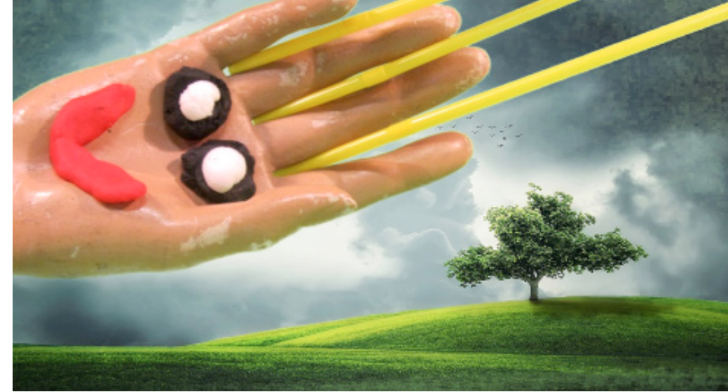
filmstill Verwend Nest, zie kader