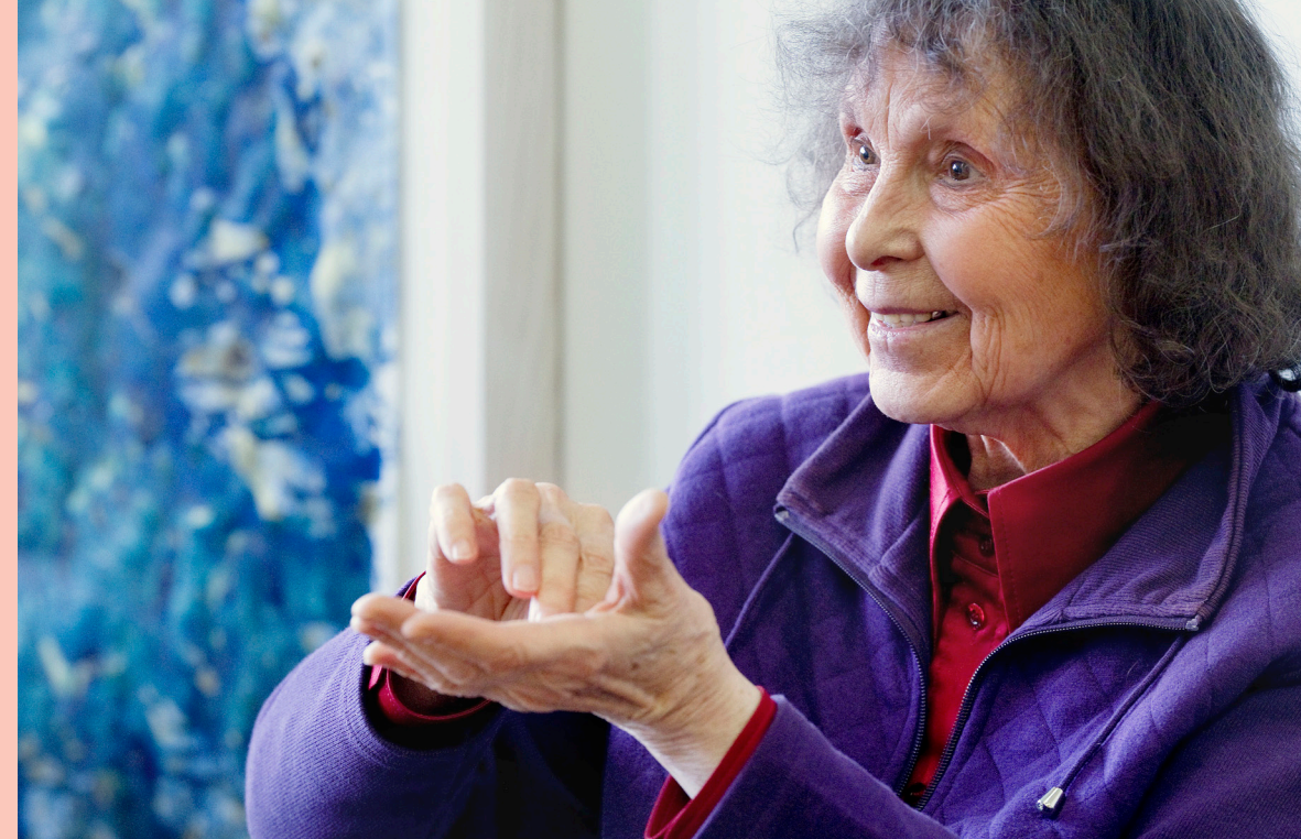
Sofia Goebaidoelina

De Russische componiste Sofia Goebaidoelina (1931) is een van de meest markante stemmen in de hedendaagse muziek. De innerlijke kracht van haar muziek is zo groot dat zij de categorieën ‘modern’ of ‘traditioneel’ overstijgt. Haar onontkoombare zeggingskracht, verfijnde gevoel voor kleur en vermogen om de stilte nadrukkelijk mee te componeren, hebben een magische werking. Er spreekt een diepzinnigheid uit haar muziek die de luisteraar bij de lurven grijpt.