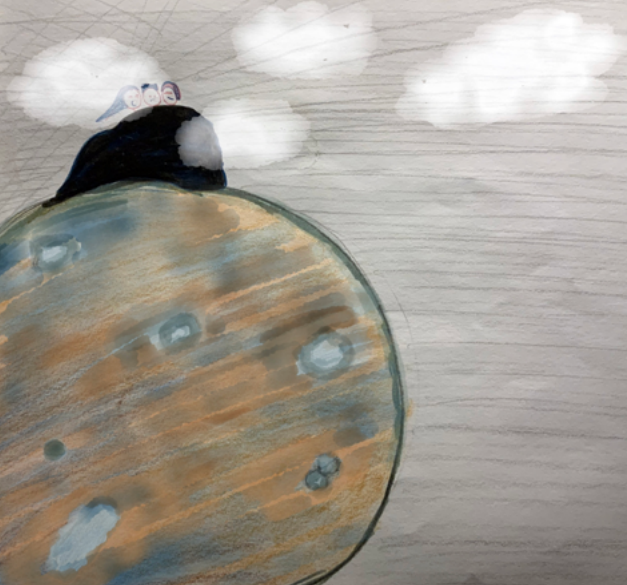
▲ Zizos, beeld Meriç Artaç ▶ Vojtěch Sembera, foto Eva Svobodová ▶▶ Viola Cheung, foto: Petar Stoykov